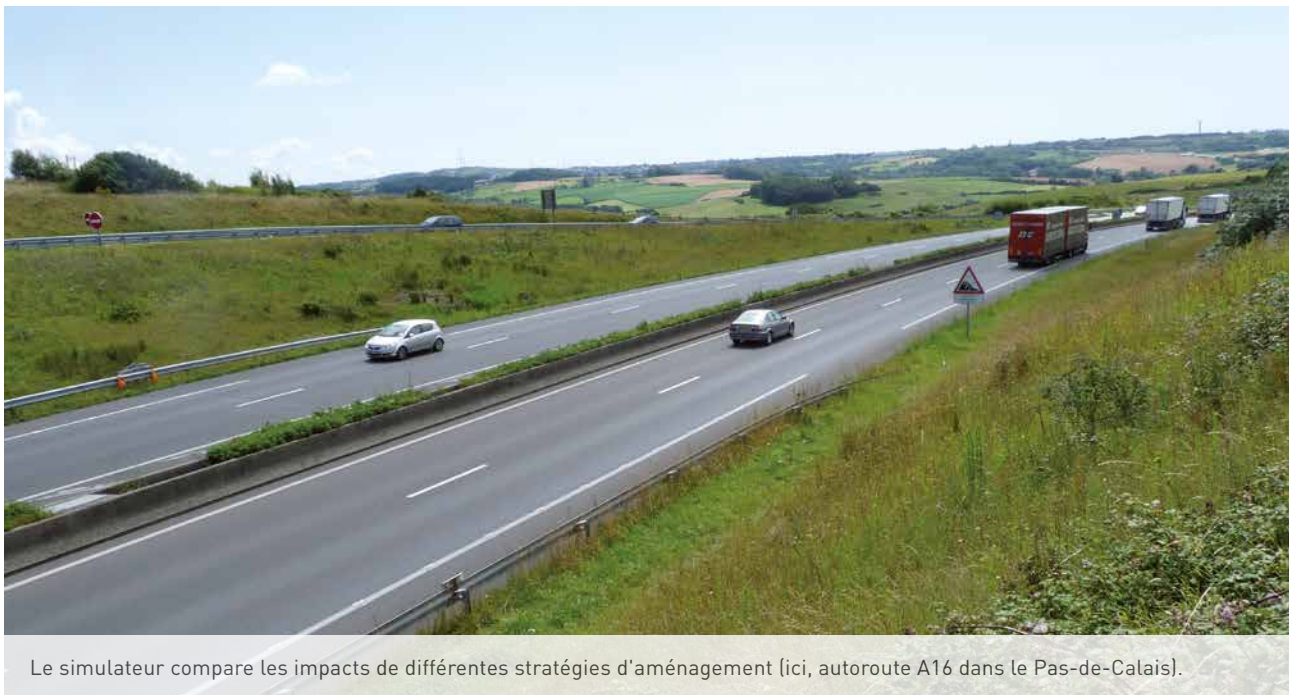
Le simulateur compare les impacts de différentes stratégies d'aménagement (ici, autoroute A16 dans le Pas-de-Calais).